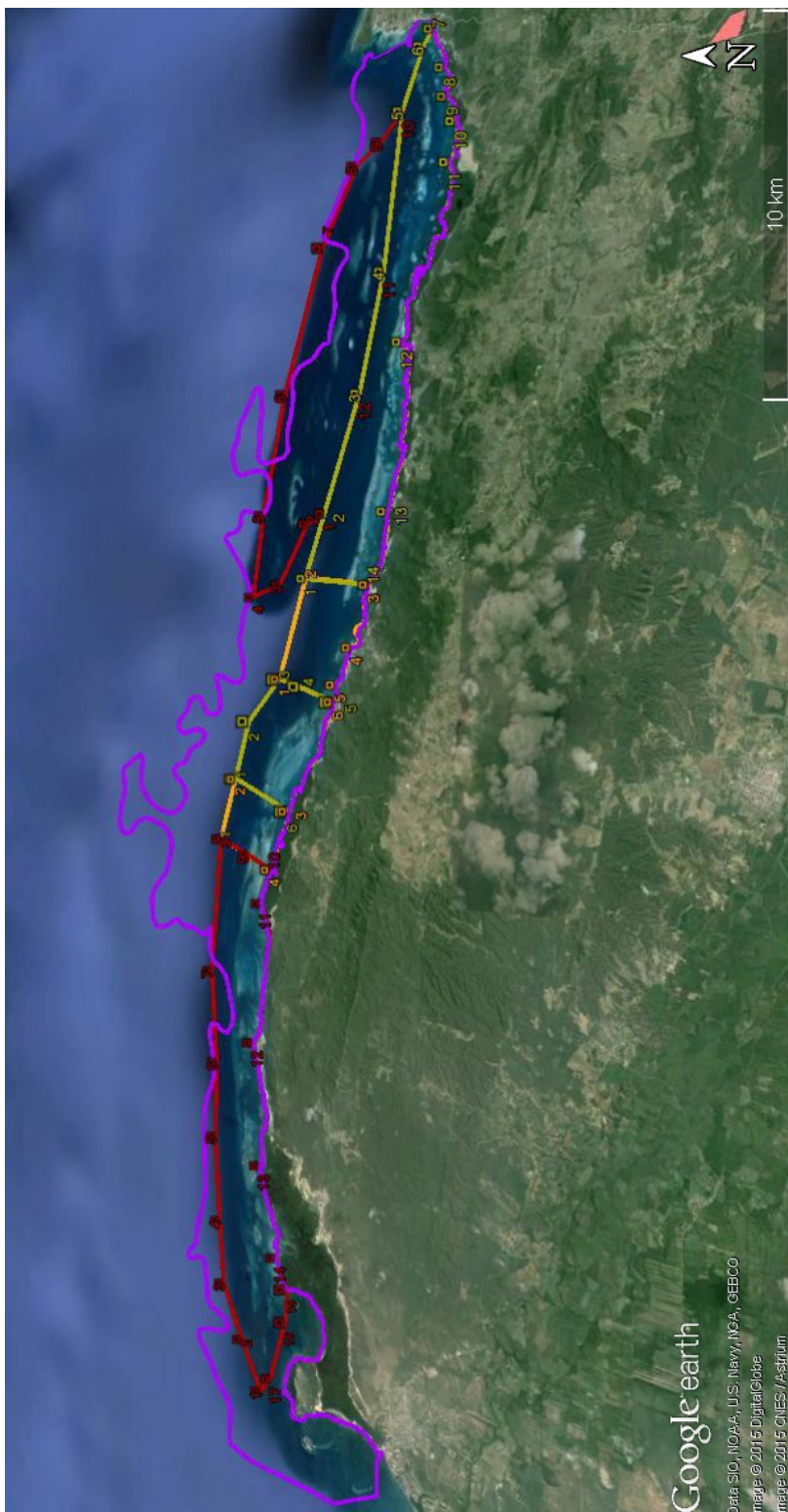
Figura 3. Zonificación propuesta para la pesca en el Parque Nacional Submarino de Montecristi, puesta sobre imagen de satélite. Zonas No Pesca (ZNP1 y ZNP2) - línea color rojo; Zonas de Pesca Controlada (ZPC1 y ZPC2) - línea color verde; Zonas Tránsito Marítimo - línea color anaranjado. Límites del PNSM – línea color lila.