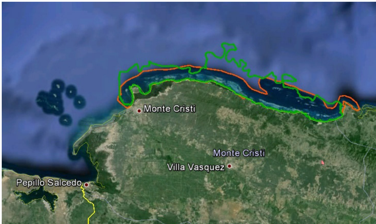
Fig. 1. Polígono completo con un área arrecifal tentativa, teniendo en cuenta diferentes zonas y conexión entre ellas en el sistema arrecifal (línea roja) junto con la delimitación del PNSM (línea verde).

La zona de la actual propuesta comprende el borde costero desde Punta Burén hasta cerca de la vertiente Este de El Morro. El sistema arrecifal de esta área forma un arrecife de franja de 48 km de longitud con una extensión de 47.5 km 2 , considerado como un arrecife en expansión activa sobre una plataforma poco profunda (~150 m de profundidad), con estructuras de alto relieve y grandes colonias de coral; posee diferentes zonas en su sistema, constituidas por diversas formaciones coralinas. El ancho del arrecife interno es variable. Las distancias que separan la cresta arrecifal de la línea de costa van desde los 25 m hasta los 2.0 Km aproximadamente. La segunda franja en el mar abierto, forma parte del arrecife externo y se extiende por unas 6 millas aproximadamente, a una distancia de 2.3 millas de la costa, con profundidades mayores de 15-20 metros.