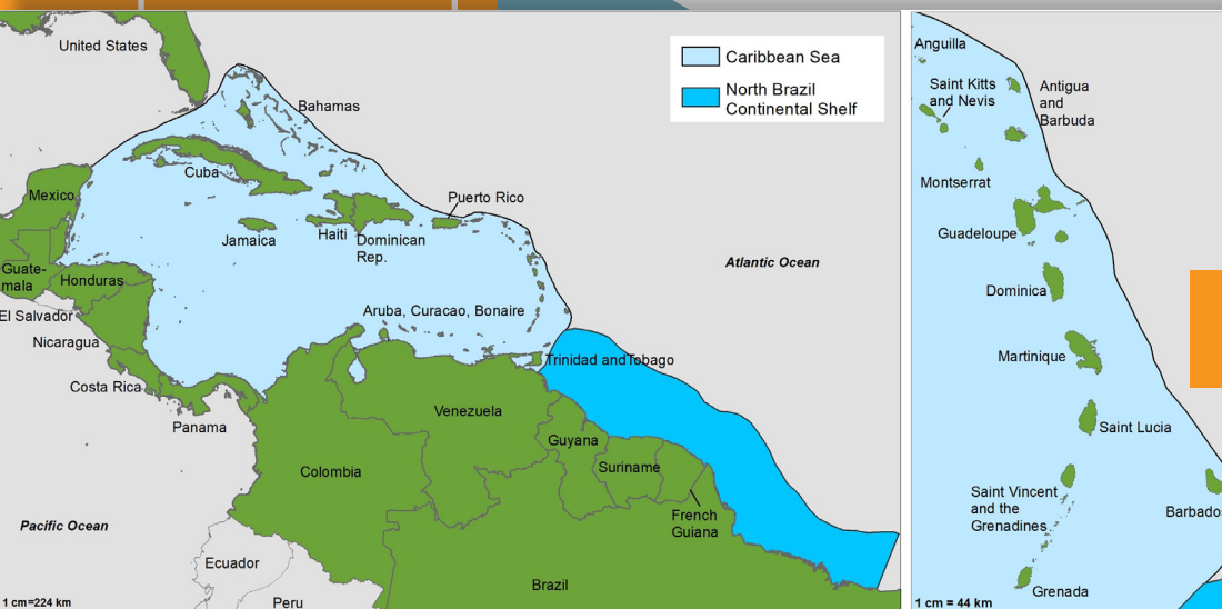
Mapa de la región CLME+